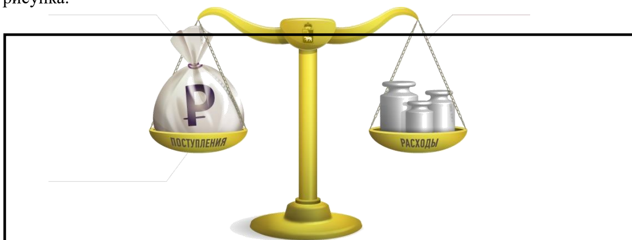
Рис. 1.1. Наименование рисунка

Иллюстрации должны иметь осмысленные названия. Номер и наименование иллюстрации располагают посередине строки после самого рисунка.